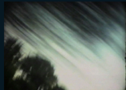
E LEI SI SCORDO'