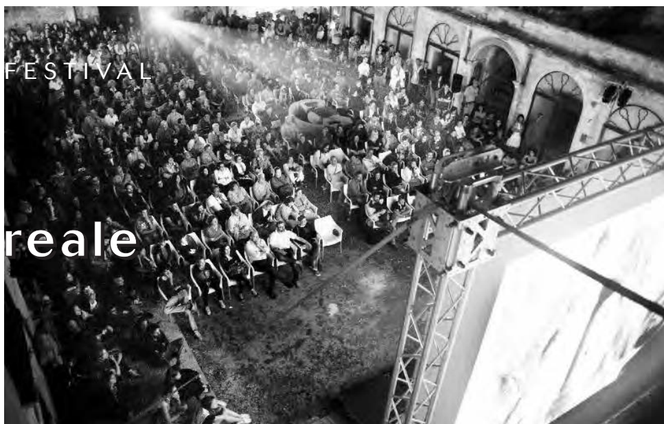
Sala a cielo aperto nel cortile del Castello Risolo.