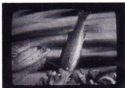
'Movimenti sul Fondo'

Een registratie van een performance. Er wordt een zelfonderzoek in de geest uitgebeeld. Herinnering, obsessie, sensatie en verbeelding worden symbolisch weergegeven met natuurlijke elementen als water, licht, wind enz.