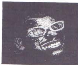
'Fake for Jazz'

Een odysee van herinneringen met foto's en flash-backs over vroeger gemaakte reizen. De video heeft een sterke arabische invloed en veel arabische muziek.