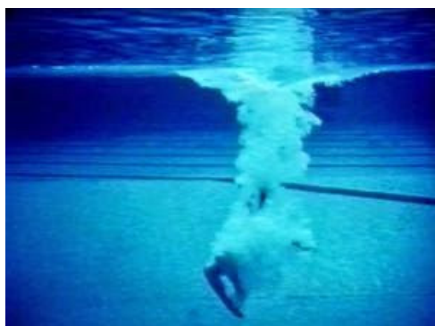
Auermühle, Mai 2003 (2003)