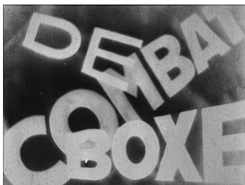
Combat De Boxe (1927) Charles Dekeukeleire