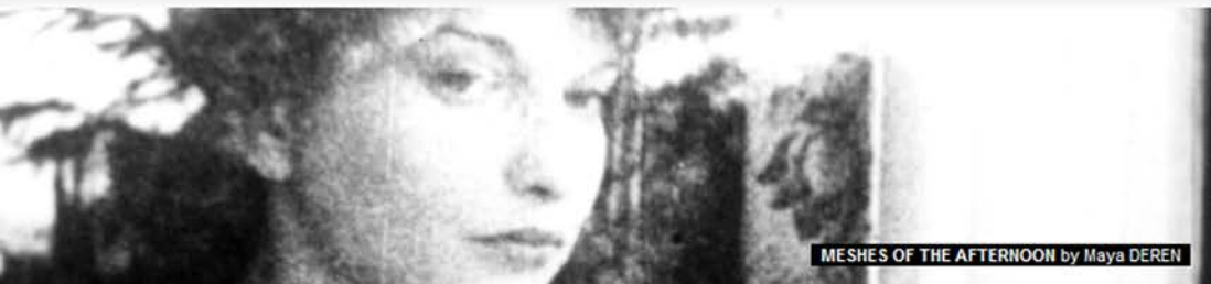
MESHERS OF THE AFTERNOON by Maya DEREK