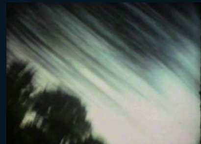
E LEI SI SCORDO'